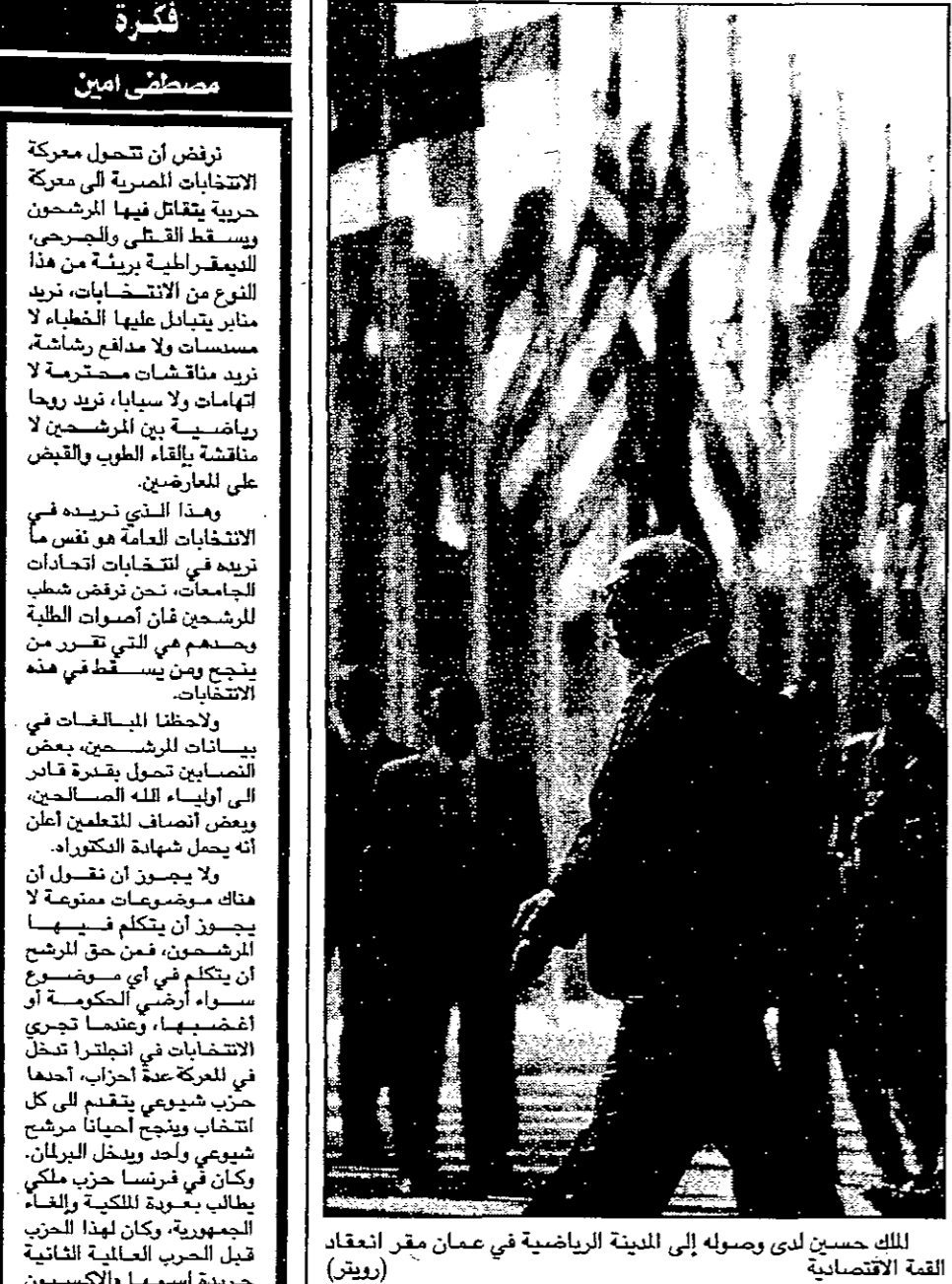
الملك حسين لدى وصوله إلى المدينة الرياضية في عمان مقر انعقاد القمة الاقتصادية (رويترز)

أدركت عمان، في هذا المؤتمر يأتي استكمالاً لمؤتمر الدار البيضاء، وبعث إلى التعاون الإقليمي بين دول المنطقة حتى تكون أكثر نجاعة وأقل تفاوتاً في مستويات التنمية الأمر الذي يعزز فرص الأمن الاجتماعي والقدرة على استثمار أسباب عدم الاستقرار. وأكد أن المشاركة والتفاعل الإيجابي مع الاقتصاد العالمي لا يتعارض مع الخطوات المتقدمة من أجل شرعية أوروبية، شرق أوسطية. المنطقة قبل العملية السلمية قال الملك حسين: إن دول المنطقة بذلت للتعاون على أسس واضحة في مجالات ثلاثة هي: البيئة والمياه والبنية التحتية في إطار التعاون الاقتصادي والسياسات البيئية الوطنية غير ذات جدوى في غياب التنسيق الإقليمي. ثم استعرض الوضع الداخلي الاقتصادي والعمالي في الأردن، وذكر في تقريره الاقتصادي والقرار القانوني اللزامة، وقال: إننا نتمنى بوضوح أنه تجارية حرة تضم دول المحور وهي: الأمير الحسين الشرق الأوسط دعا وزير الخارجية الأميركي واين كريستوفري على إلغاء المقاطعة العربية لإسرائيل، وتحت ضغط حميمي من الشرق العربي وبما لوجهه بمبادرات السلام، وأشار إلى أن السلام بدأ يبطل مكامس في إسرائيل والأردن وقال حسان الوقت لكنها مرة أخرى، ما ساء ويبدأ وزير الخارجية الأميركي واين كريستوفري كلمته مشيداً بجهود الملك حسين عامل الأردن ورئيس الوزراء الإسرائيلي اسحق رابين والرئيس الفلسطيني ياسر عرفات والرئيس المصري مبارك والملك الحسين الثاني عامل المغرب وآخرين وقال إن